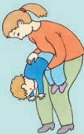
Hvis barnet er over 1 år

Ring 112, hvis du ikke kan få fremmedlegemet op, eller hvis barnet bliver bevidstløs.