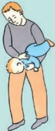
Hvis barnet er under 1 år

Hvis barnet er under 1 år og ikke trækker vejret eller ikke kan hoste, læg da barnet som vist på tegningen og giv 5 klask med flad hånd mellem skulderbladene. Hvis fremmedlegemet ikke kommer op, vend